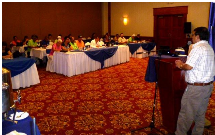
Procompetencia de Nicaragua inauguró el inicio de una jornada de capacitación que se extenderá hacia el próximo año en coordinación con el Instituto Nacional de la Competencia de la Dirección de Políticas de Comercio del MIFIC y el Instituto de defensa del Consumidor INDEC.