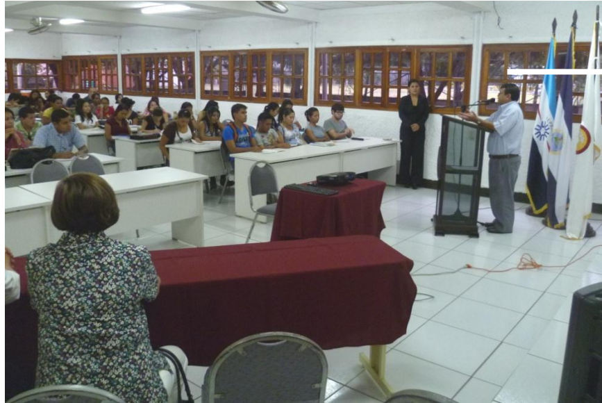
La Universidad de Ciencias Comerciales de León, resultó ser la sede para realizar la primera conferencia sobre nociones general de competencia a inicio de este mes de octubre.