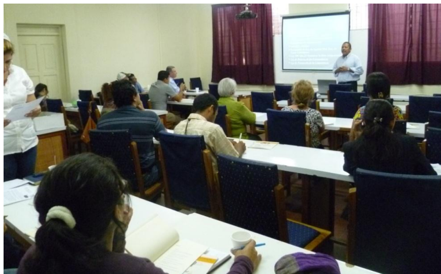
Con el apoyo de autoridades del Ministerio de Economía Familiar Comunitaria y Cooperativa de Matagalpa se llevó a efecto un importante taller de capacitación sobre la Ley 601 y su ámbito de aplicación.